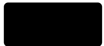
C31 BLACK MAT

polecamy dedykowane akcesoria: półka PB-ESCE we recommend dedicated accessories: PB-ESCE shelf