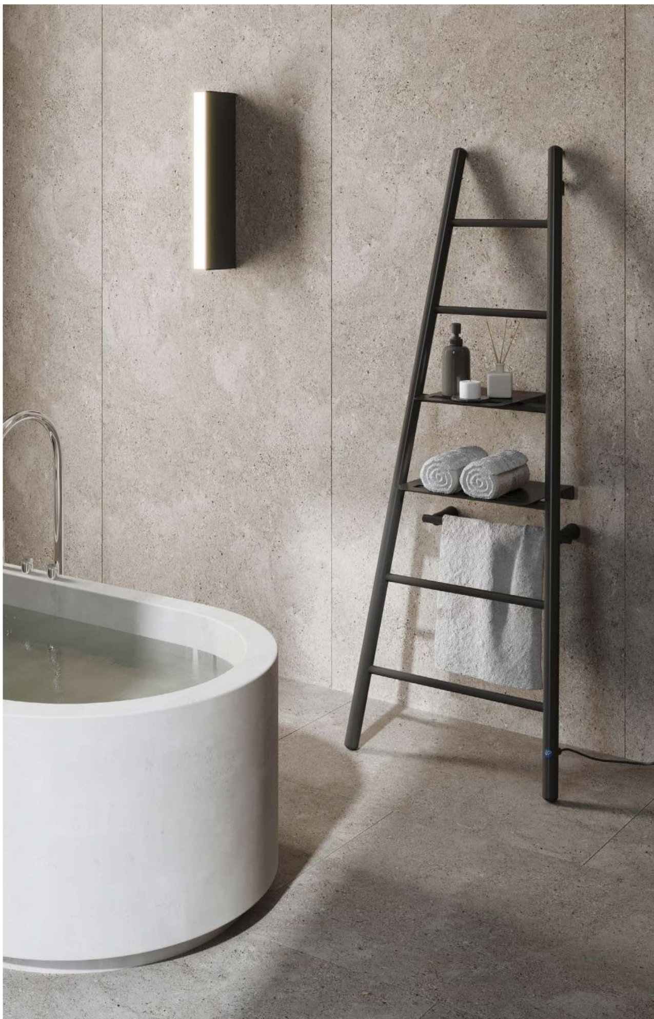
Na aranżacji: grzejnik elektryczny ESCE1-60/160C31 In the visualisation: ESCE1-60/160C31